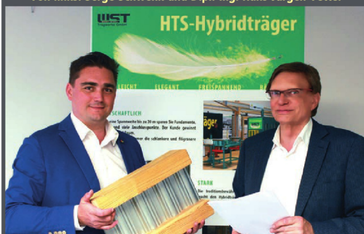
mit dem Muster eines HTS-Hybridträgers